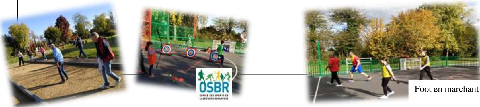
Foot en marchant

L'inauguration a été suivie du partage du verre de l'amitié, accompagné des plats cuits au four à pain de la commune.